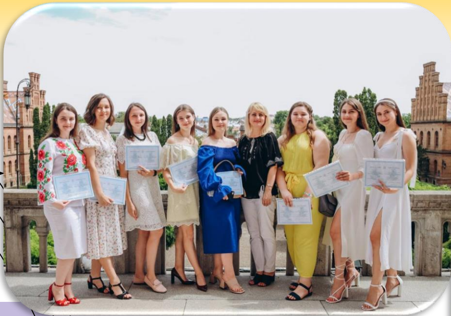
Вручення дипломів 10.07.2022